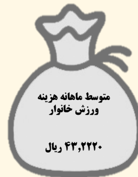
متوسط هزینه ورزش خانوارهای استان‌های منتخب و سایر استان‌ها در ماه - سال ۱۳۹۶ (بر حسب ریال)